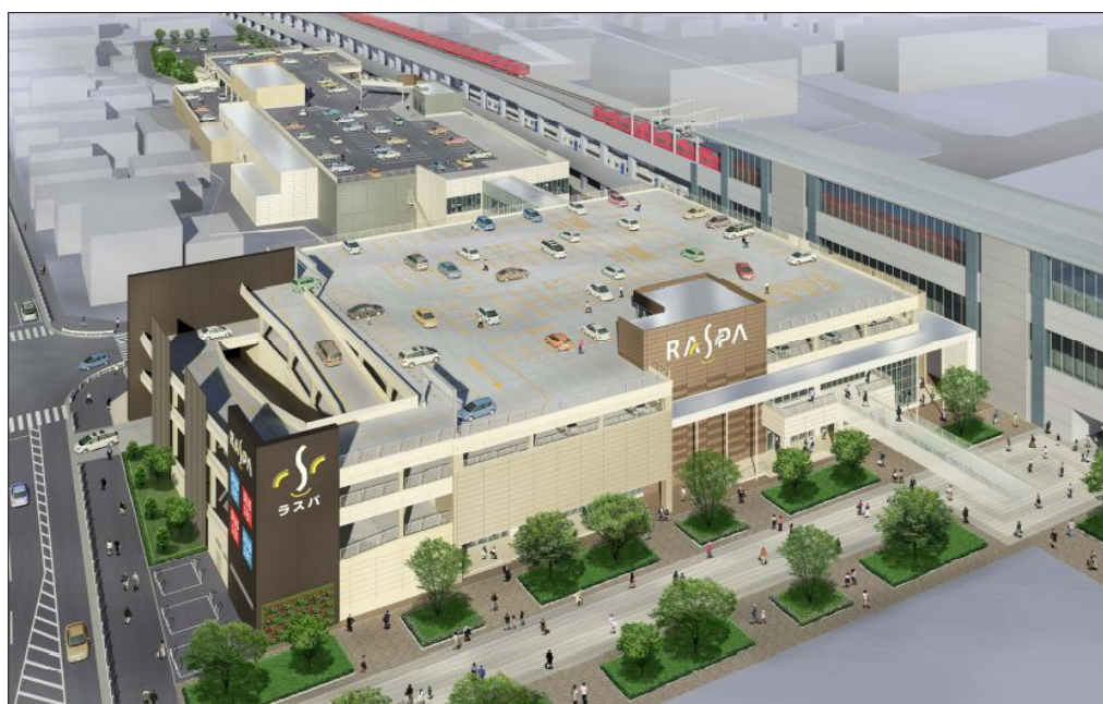
ラスパ太田川 外観イメージ

当該地区は、東海市の中心駅である太田川駅の西側に位置し、商業・文化・教育・住宅が一体となった複合エリアとして再開発が進められています。今後は大ホールなどを備えた総合文化施設のほか、日本福祉大学の東海キャンパスの開設などが予定されています。当モールは、再開発エリアの中心となる商業施設として、「笑顔の人が集まる場所」という想いを込めた「ラスパ」の実現を目指し、お客様の毎日の暮らしに楽しい買い物空間を提供してまいります。