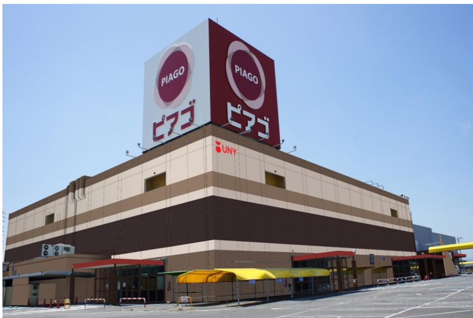
ピアゴ江南店外観イメージ

今回のリニューアルでは、「地域に愛され続ける日常生活便利店」をコンセプトに、大幅に店内改装を実施しました。直営のスーパーマーケットは売場面積を約15%拡大し、日用消耗品や家庭用品などの住居関連品を新たに品揃えするほか、シニア層のニーズに対応するため、調理が簡単な食品や、旬や鮮度、味にこだわった食品を少量から品揃えします。また、専門店舗数を約2.5倍に増やし、2階フロアの半分を使いアミューズメント施設2店舗が出店するなど、あらゆる世代のお客様に毎日のお買い物を楽しんでいただける店舗を目指してまいります。