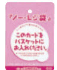
日本チェーンストア協会