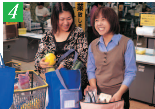
精算終了後、ご持参のマイバッグに購入商品を入れてください。外側の透明ポケットにはレシートを入れていただけます。