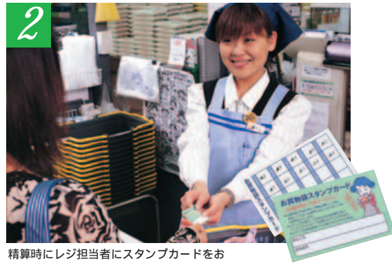
精算時にレジ担当者にスタンプカードをお渡ください。