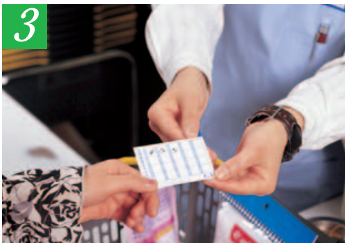
カードにスタンプを押してお返しします。