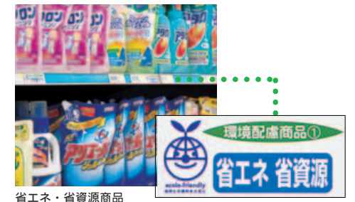
省エネ・省資源商品

ユニーでは取り扱い商品の中で、より環境にやさしい商品をお客様に紹介しています。それぞれの商品がどのように環境にやさしいかを、表示カードでわかりやすく説明しています。エコの仕組みを説明した表示カードは見やすく、読みやすい表示にしています。お客様が商品の特性を理解された上で、環境にやさしい商品を選びやすいよう配慮しています。