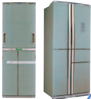
ノンフロン冷蔵庫