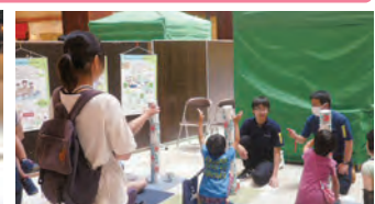
丸越 リサイクル(3R)を学ぶゲーム