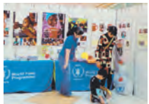
ブース展示の様子

ユニーは食品を扱う企業として国連WFP協会に加盟し、従業員を対象にワンコイン募金活動を実施しています。本社や店舗では毎月第一日・月曜日にポケットのワンコインを募金してもらい、開発途上国の子どもたちの給食プログラムに贈っています。2016年度は100万円寄付しました。