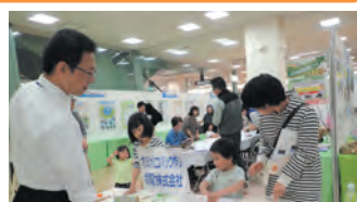
北陸電力 オリジナルエコバッグ作りワークショップ