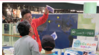
山梨県地球温暖化防止活動推進センター 公益財団法人キープ協会 星見版作り