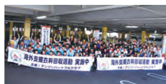
デンソーハートフルクラブ

車イスの修理ボランティアを行っているWAFCAとあいおいニッセイ同和損保が共同でアピタ刈谷店で障がい者支援のイベントを開催しました。