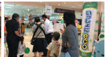
花王 いっしょにecoの取り組み紹介