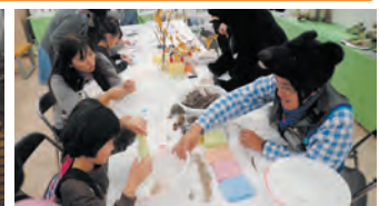
トヨタ白川郷自然学校 くろもじにおい袋づくり