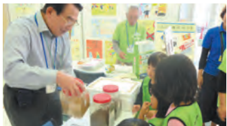
しずおか市消費者協会 環境に優しい暮らし実践紹介