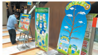
栃木県地球温暖化防止活動推進センター エコライフ体験コーナー