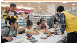
国立立山青少年自然の家 桐きりストラップ作り