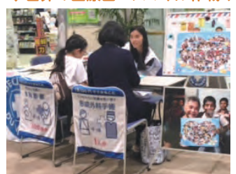
スマイル作戦キャンペーン

先天性の病気やけが、戦争などで顔に傷を負った発展途上国の子ども達に医療支援をすることで笑顔を贈る活動です。2016年度には24店舗で開催し、641名が参加して、子ども達にメッセージを贈り、140万円(年間)の寄付金振り込みの手続きをしていただきました。