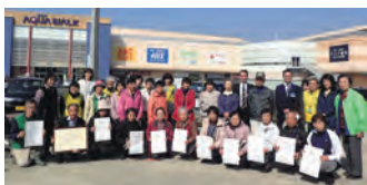
ユニーより感謝状をお贈りしました