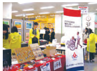
WAFCA (ワフカ) 車イス支援活動