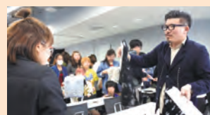
熱心に質問をする学生達