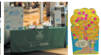
ユニー みんなのエコ宣言