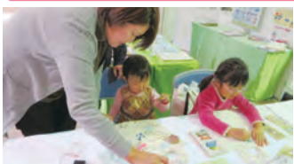
やまなし環境財団 オリジナルマイバッグ作り