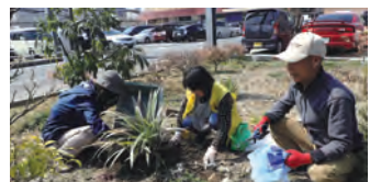
花壇の整備を行うサポーターの皆さん

岐阜県大垣市のアクアウォーク大垣には、大垣市環境市民会議との共同で作上げた環境大臣賞受賞の「レジ袋 市民の森」があります。市民のボランティア「グリーンサポーター」が木や花の管理に活躍しています。