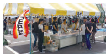
トヨタ紡織ボランティアセンター