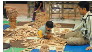
神奈川県 かまぼこ板つみきあそび