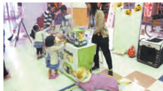
全国盲導犬施設連合会 盲導犬のふれあい