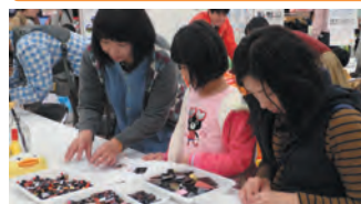
福井小水力利用推進協議会 眼鏡端材を使ったアクセサリー作り