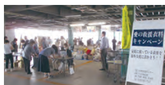
名古屋を明るくする会