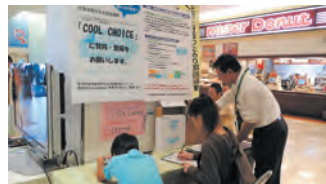
新潟県地球温暖化防止活動推進センター COOL CHOICE紹介