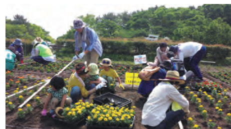
市民ボランティアの皆さん

名古屋市名城公園・花の山エリアにある「ユニーの花壇」を、市民ボランティアと一緒に花を植えたり雑草を駆除したりする活動を行っています。小さな子どもも家族と一緒に参加してくれました。