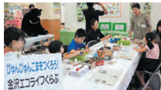
金沢エコライフくらぶ びゅんびゅんごまをつくる