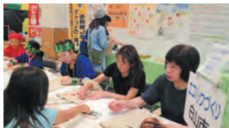
白山市 オリジナルエコバッグづくり