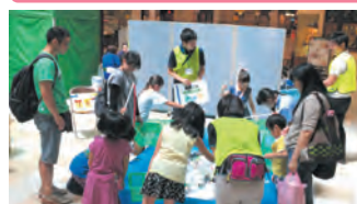
前橋市 分別釣りゲーム