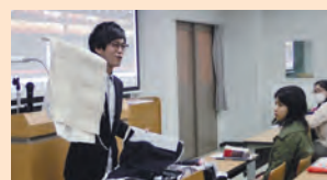
学生に開発生地の説明を行う

地元アパレルメーカーの商品開発担当者、障がい者支援支援施設の担当者や通所者の方々と共に学校に出向き、プロジェクトについての説明を行いました。海外の高級メーカーが使用している生地サンプル開発担当者が直接説明をし、生地を実際に触れ、学生達は驚きの声を上げていました。