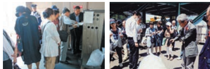
名古屋中区生涯学習センター環境講座 NACS(日本消費生活アドバイザー・コンサルタント・相談員協会)見学

消費者団体や環境市民講座などの店舗の環境施設や環境活動の見学を受け入れています。特に廃棄物分別計量や食品リサイクルループに関心が高いようです。