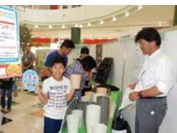
ボトルキャップ運動で植木鉢プレゼント (いその)