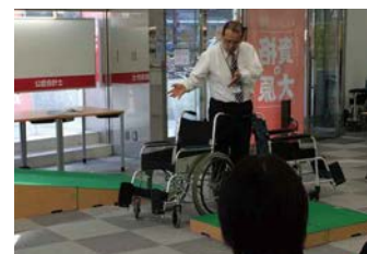
車椅子の介助訓練

ユニーでは2007年からサービス介助士の資格取得を進めています。高齢化社会が進み、高齢者や障がいをお持ちの方にも安心してお買い物をしていただくために、サービスレベルの向上を目指し、店長、副店長から資格の取得を進めてきました。現在サービス介助士の資格取得者人数は1,657名です。今後も高齢者や障がいをお持ちのお客様のお買い物サポートに取り組んでいきます。