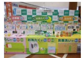
「いっしょにeco」を伝える (花王)