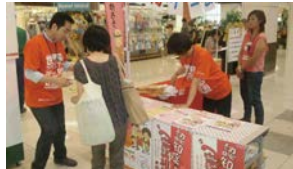
店舗で認知症アンケートを実施