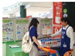
リターナブルピンの使用 (明治)