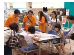
未来のあたりまえを作るエコ工作 (大日本印刷)