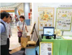
段ボールコンポストの紹介 (大垣市環境市民会議)