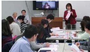
従業員への認知症サポーター教育を実施

高齢化社会が進みつつある中で、ユニーでは認知症の方にも安心してお買い物を楽しんでいただけるようサポートに努めています。従業員には認知症への理解と見守りの役割を担うための教育を行い、店内での困りごと対応やお手伝いで支援しています。また一般のお客様にもご理解・協力をさせていただくために店内で認知症支援のボランティアや市の職員、支援している大学と一緒に認知症サポート啓発イベントを開催しています。