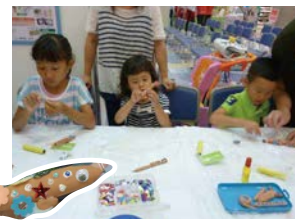
おがくず粘土で世界に1つだけの鉛筆をつくりました。