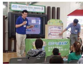
環境紙芝居で子どもにも大人にもわかりやすい「賢い選択」を学びました。