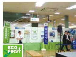
ゼロエネルギー住宅・省エネソリューション相談会 (積水ハウス)