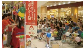
店舗での啓発イベント