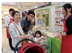
ヤマザキのエコプロダクツ減装ショッピング (山崎製パン)