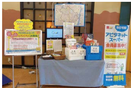
ネットスーパーの紹介

またお客様の使用済み容器包装を商品納品の時に回収するなどリサイクルも推進しており、お客様に便利で環境にも配慮した取り組みを進めていきます。こども虐待防止オレンジリング運動に協力し高齢者だけでなく地域のこどもの見守りの啓発に取り組んでいます。