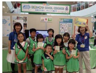
ユニーブース前でエコキッズツアー