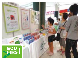
環境にやさしい商品や環境社会貢献活動を紹介 (ライオン)