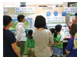
CO 2 CO 2 減装パッケージ (日本ハム)