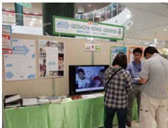
ユニーの環境展ブース