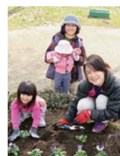
市民ボランティア

名古屋市の名城公園の花のエリアにある「ユニーの花壇」を、市民ボランティアと一緒に花を植えたり雑草を駆除したりする活動をしています。小さな子ども達も家族と一緒に参加してくれました。