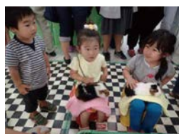
動物たちとの触れ合い (日本モンキーセンター)