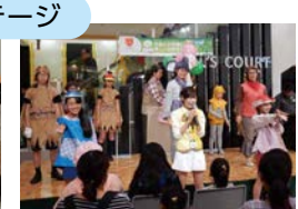
自然と共に生きるをテーマにしたミュージカル (劇団シンデレラ)