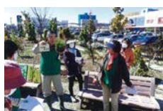
レジ袋 市民の森 グリーンサポーター活動

岐阜県大垣市のアクアウォーク大垣には、大垣市環境市民会議との協働で作り上げ、環境大臣賞受賞の「レジ袋 市民の森」があり、市民のボランティア「グリーンサポーター」が木や花の管理に活躍しています。