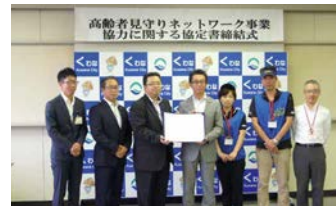
桑名市との協定書締結式

桑名市のアピタ、ピアゴが市の高齢者見守りネットワーク事業に協力し、店舗での認知症のお客様の対応や、ネットスーパーの商品を配達時に異変に気付いた場合は包括支援センターに連絡するなど、地域の高齢者の見守りに協力します。