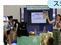
白川郷の動物と自然の紹介 (トヨタ白川郷自然学校)