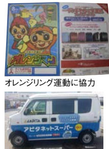
ネットスーパー配達車