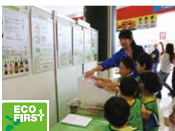
キリングループの容器包装3Rの取り組み (キリン)