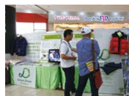
グリーндаウンプロジェクトの活動紹介 (GreenDownProject)