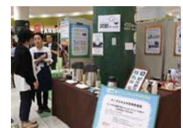
サステナブルコーヒーの試飲 (珈琲工房ひぐち)