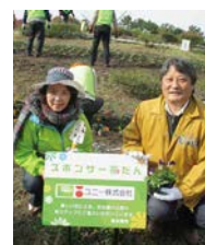
ユニーの花壇の花植え