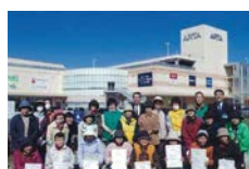
サポーターへ感謝状を贈る