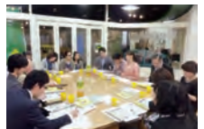
インタープリター研究会

ユニーのインタープリター・ボランティアや地域のNPOの皆さんと、環境教育の研究会を行っています。日頃の活動の課題対策や新しいカリキュラムなどを習得し、環境教育の推進に役立ててもらっています。