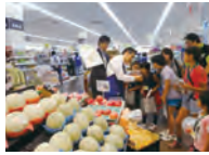
地域の人達の見学会

店舗の施設見学や環境活動の見学に、消費者団体・行政・同業者の方を受け入れています。特に多いのは、食品リサイクルグループの仕組みやエコ野菜販売などについての見学です。