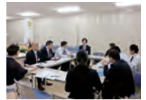
各エリア環境担当者連絡会

関東・山静・北陸と中京エリアを担当する、環境担当者を集めて店舗での環境対策や環境イベントの打ち合わせや、学習会を開催しています。