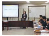
新任店長・部長室長教育

管理職に登用された社員には、それぞれの職制に必要な環境保全・社会貢献の教育を行っています。特に店舗管理職には、店舗に関わる法令やその他の要求事項について、その内容と遵守するための取り組みについての講習を行っています。