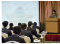
新入社員オリエンテーション

ユニーの環境方針の理解や店舗・事業所での環境保全活動について、新入社員オリエンテーションで教育を行っています。