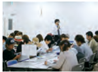
店舗テナント環境教育

店舗に出店しているテナントやそこで働く人達に、環境保全活動を理解し協力してもらうための教育を実施しています。特に廃棄物の分別計量システムや排水に関する教育は、店舗ごとにマニュアルやDVDを使って行っています。