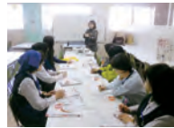
店舗での認知症教育

ユニーの従業員以外の派遣社員やその他社内で働いている人達に、環境に関する社内ルールや認知症支援活動などについて、理解し協力してもらうように教育を行っています。