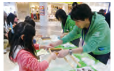
インタープリターとして活躍