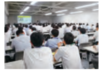
ISO14001本社従業員集合教育

環境マネジメントシステム14001の適正な運用と、それぞれの仕事から環境影響を抽出し、環境実施計画を策定し、目的目標を達成するための教育を行っています。