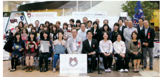
表彰式に参加した皆さん