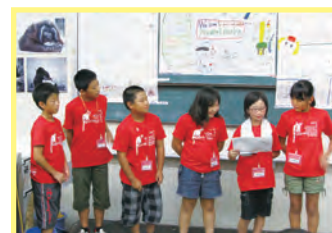
みんなで協力して未来の理想の動物園を考えて発表したよ