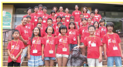
人間に一番近い生き物のことを学んだ2日間でした!