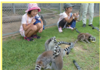
サルが仲良くご飯を食べているところを観察したよ