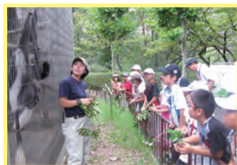
センターに生えている葉っぱがサルの食べ物になったよ

2011年より日本モンキーセンター（現：公益財団法人日本モンキーセンター）で生物多様性について学ぶサマースクールを開催しています。「ぼくの私の好きな生き物」をテーマに応募した23名の小学生が愛知県犬山市の日本モンキーセンターで、人間に一番近い生き物であるサルのことを学んだり、理想の動物園を考え発表したりしました。