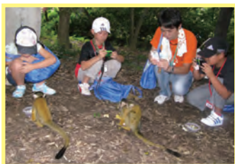
手を使って上手に食べていることがわかったよ