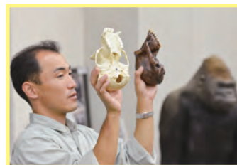
学芸員さんにサルの骨の説明をもらったよ