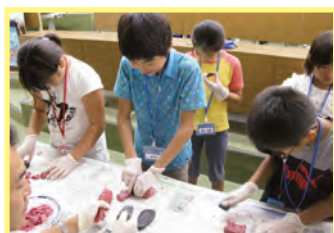
川の水で磨製石器作りに挑戦!肉が切れたよ