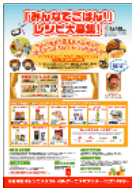
レシピコンテストを実施