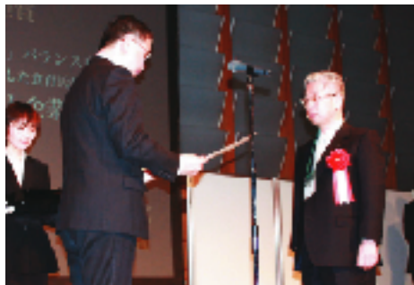
「地域に根ざした食育コンクール2008」にて農林水産大臣賞（最優秀賞）を受賞

この活動が認められ、2008年度「地域に根ざした食育コンクール」で最優秀賞である農林水産大臣賞を受賞しました。