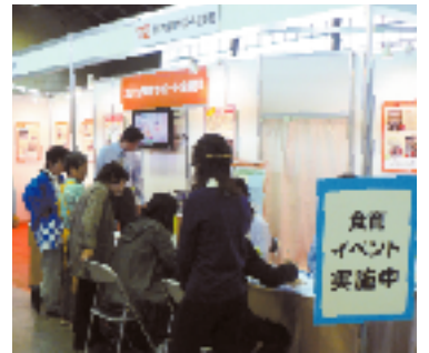
ふるさと農林水産フェアに出展