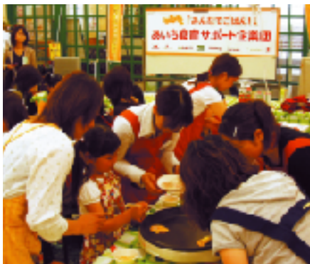
あいち食育サポート企業団で店頭イベントを実施