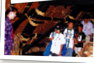
「白川郷の旅」白川郷合掌集落ガイドウォーク