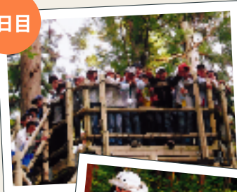
大自然の朝を体験