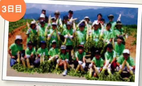
ひるがの高原「野菜収穫体験」