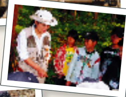
環境とエネルギーの実験