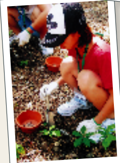
どんぐりの稚樹を森へ返す