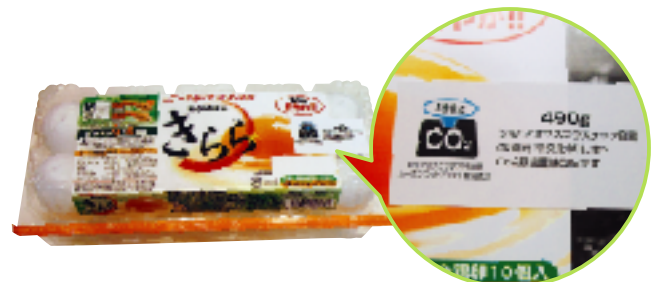
商品にカーボンフットプリント・マークを表示