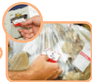
シールを発行します。同時にデータは事務所の端末に記録、集計され、本社環境社会貢献部の端末に送信されます。テナントや売場には毎月集計された結果が告知されます。