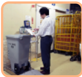
計量器に載せ、重量を計ります。