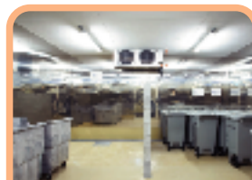
計量した廃棄物は、それぞれ温度管理された廃棄物庫で保管されます。腐敗しやすい食品廃棄物などは冷蔵保管されます。