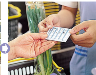
カードにスタンプを押してお返しします。