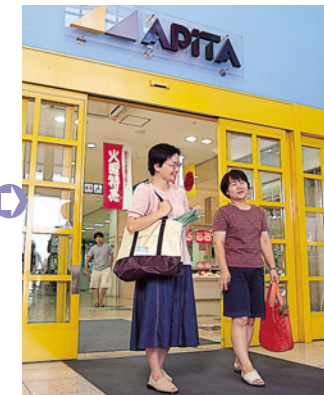
お気に入りのマイバッグで、エコ・ショッピング！