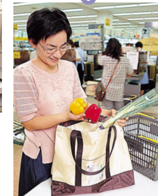
精算終了後、持参されたマイバッグに購入商品を入れてください。外側の透明ポケットにはレシートを入れていただけます。