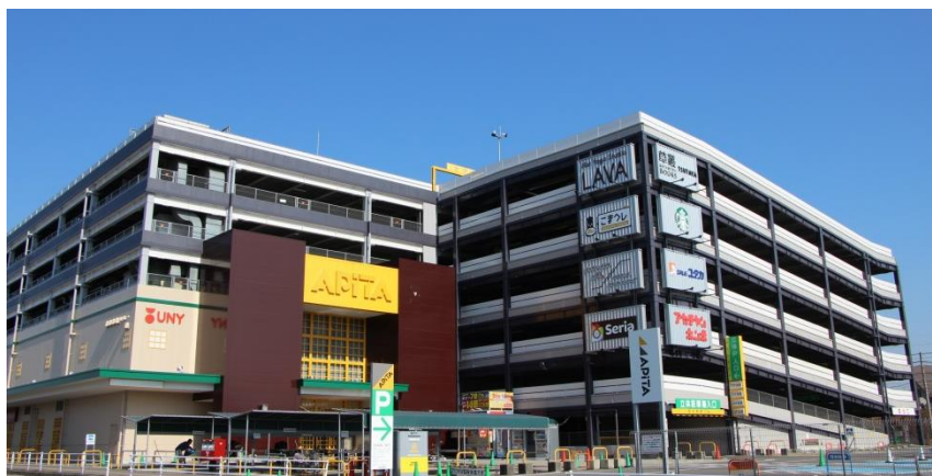
アピタ新守山店外観

当店は、今回の改装によりアピタ店舗のコンセプトである“おしゃれ、楽しい、新しい”売場を実現し、相互送客を図るとともに「地域のお客様から喜ばれ、信頼される店舗」のコンセプトの下、常に地域のお客様に愛され続け、「商品」「価格」「サービス」を充実させてまいります。