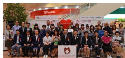
昨年の表彰式の様子 (9/8 リーフウォーク稲沢にて)