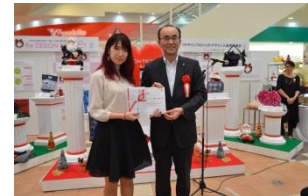
昨年の表彰式の様子 (9/8 リーフウォーク稲沢にて)