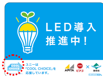
ステッカーのイメージ