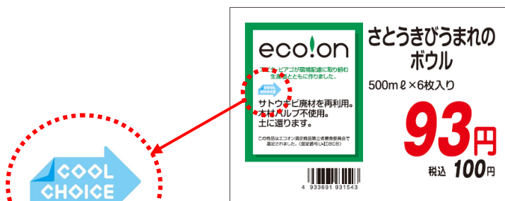
ポップのイメージ