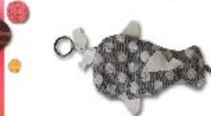
フィッシュケース 598円(税込645円)

ユニーは持続可能な社会とは、 環境だけでなく、みんなが幸せに 生きることができる社会だと考えます。 未利用繊維素材を使用し、より 使いやすく、美しいデザインで、障が い者の方たちに生産を担っていただ く「リデザインプロジェクト」を進め ています。