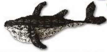
くじらのぬいぐるみ 980円(税込1,058円)

子どもだけでなく大人にも手に取っていただける よう、シンプルな色のくじらにしました。