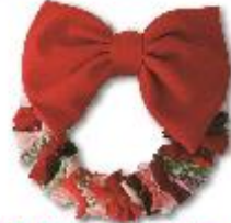
プレゼントリース 698円(税込753円)

可愛さだけでなく、実用性も兼ね備えたアイテム。 日常の中でホッと癒してくれる存在です。