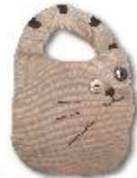
しっぽーち 598円(税込645円)

ネコのしっぽをモチーフにしたポーチで、マイバッ グの手持ちに付けて持ち歩けます。