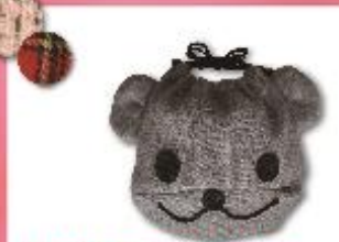
くまの巾着 598円(税込645円)