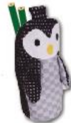
ペンギンペンケース 598円(税込645円)

ネコのしっぽをモチーフにしたポーチで、マイバッ グの手持ちに付けて持ち歩けます。