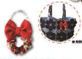
ミニプレゼントリース 498円(税込537円)

色とりどりの端切れをすべて手作業で結びつけたキュートなリース。大きなリボンがポイント！ 1点ずつ生地の組み合わせが異なるのでお気に入りを見つけてください。