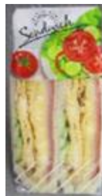
手作りたまご焼サンド

ユニーは、今後もお客様のさらなるニーズにお応えするために、充実した惣菜の開発に取り組んでまいります。