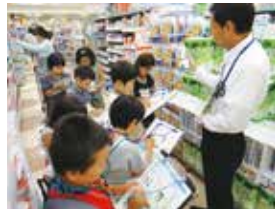
お店探検で店長が説明