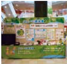
環境イベントでeco!onを紹介

環境配慮商品は購入していただいて、はじめて地球環境に貢献できます。そこでユニーでは、お客様に環境配慮商品を知っていただき、さらに購入していただくために、環境イベントや環境学習で取り上げ説明しています。また、小学生が店舗見学で使用する「環境学習ワークシート」には、環境配慮商品eco!onだけではなく、エコマークやバイオマークなどの環境ラベルについて紹介されています。店舗見学では売り場で環境配慮商品を探す体験も行っています。