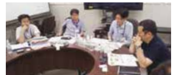
eco!on認定候補商品のプレゼン