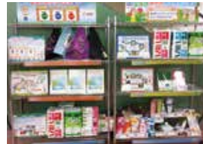
夏休み自由研究応援隊で展示