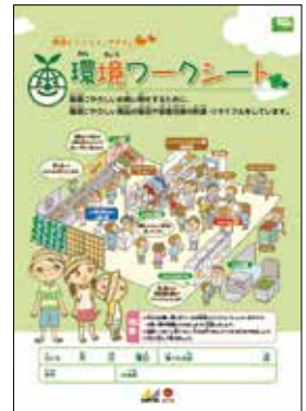
環境学習ワークシート