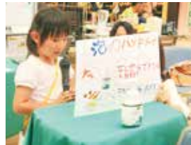
お気に入りのeco!onのPOPを作りました