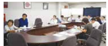
毎月開かれるeco!on開発プロジェクト