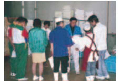
テナントに対しても環境教育を実施