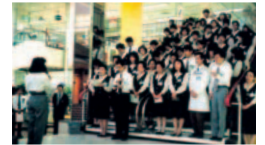
お買物袋持参運動の説明を受ける従業員(1989.11 サンテラス一宮店)