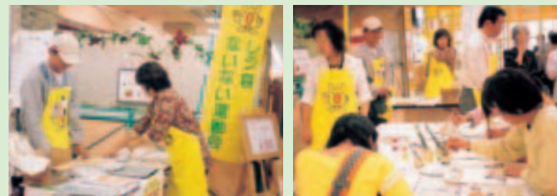
白い買物袋に絵を描いて、自分だけのお買物袋が完成

三重環境県民会議で、2000年8月から「レジ袋ゼロ運動」の実施が決定され、翌2001年10月から四日市市などで「レジ袋のない運動会」がスタートしました。ユニーもこの運動にいち早く参加し、環境保全を考えてきました。