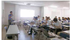
店舗テナント教育

店舗に出店しているテナントやそこで働く人達に、環境保全活動を理解し協力してもらうための教育を実施しています。特に廃棄物の分別計量システムや排水に関する教育は、店舗ごとにマニュアルやDVDを使って行っています。