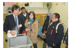
食品リサイクルに必要な廃棄物分別を見学

JICA(独立行政法人国際協力機構)の課題研修「生物多様性を活かした地域開発」として、アジアやアフリカ、南米からの見学を受け入れています。未利用食品を再生利活用した、循環型農業の取り組みは、生産地の土壌や生態系に影響を与えない、生物多様性を大切にされた農業です。