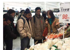
リサイクルループで生産した野菜売場