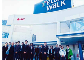
日本ショッピングセンター協会店舗視察

店舗の環境施設見学や環境活動の見学に、消費者団体、行政、同業他社などを受け入れています。特に廃棄物の分別計量や食品リサイクルループに関心が持たれています。