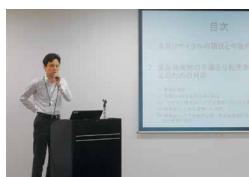
環境省より「廃棄物の適正処理」についての講演

ユニーと取引のある一般廃棄物や産業廃棄物、リサイクルなどに関係する事業者を集めて、年2回情報交換と法令などの勉強会を開催しています。ユニーの目指す環境保全活動を同じ価値観で実施してもらうために行っています。