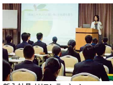
新入社員オリエンテーション

新入社員オリエンテーションのカリキュラムに、環境方針の理解や店舗・事業所での環境保全活動、地域社会貢献活動を入れた教育を行っています。