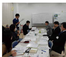
省エネに関する教育受け入れ

関東・山静・北陸と中京地区の環境担当者に、環境教育や省エネ、廃棄物管理などの教育や情報交換を実施しています。