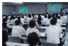
ISO14001 本社従業員集合教育

環境マネジメントの適正な運用と、それぞれの業務から環境側面を抽出し、環境実施計画を策定、目的目標を達成するための教育を行っています。