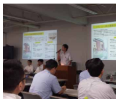
グループ企業従業員教育

グループ企業や店舗で働いている社外の人達にも、環境保全や認知症支援の教育を行っています。