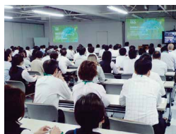
2015年度は延べ329人が参加