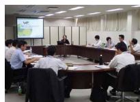
新任店長・部長室長教育で環境教育を実施

管理職に登用された社員には、それぞれの職制に必要な環境保全・社会貢献に関する教育を実施しています。特に店舗に関する法令の内容や遵守について講習を行っています。