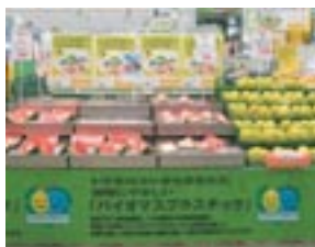
フルーツ用プラスチックケース

動植物を原料としたプラスチック 使用後は水と二酸化炭素に分解され、 自然に戻ります。