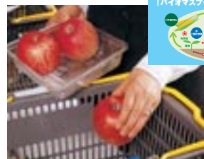
バイオマスプラスチックケースはレジにて回収